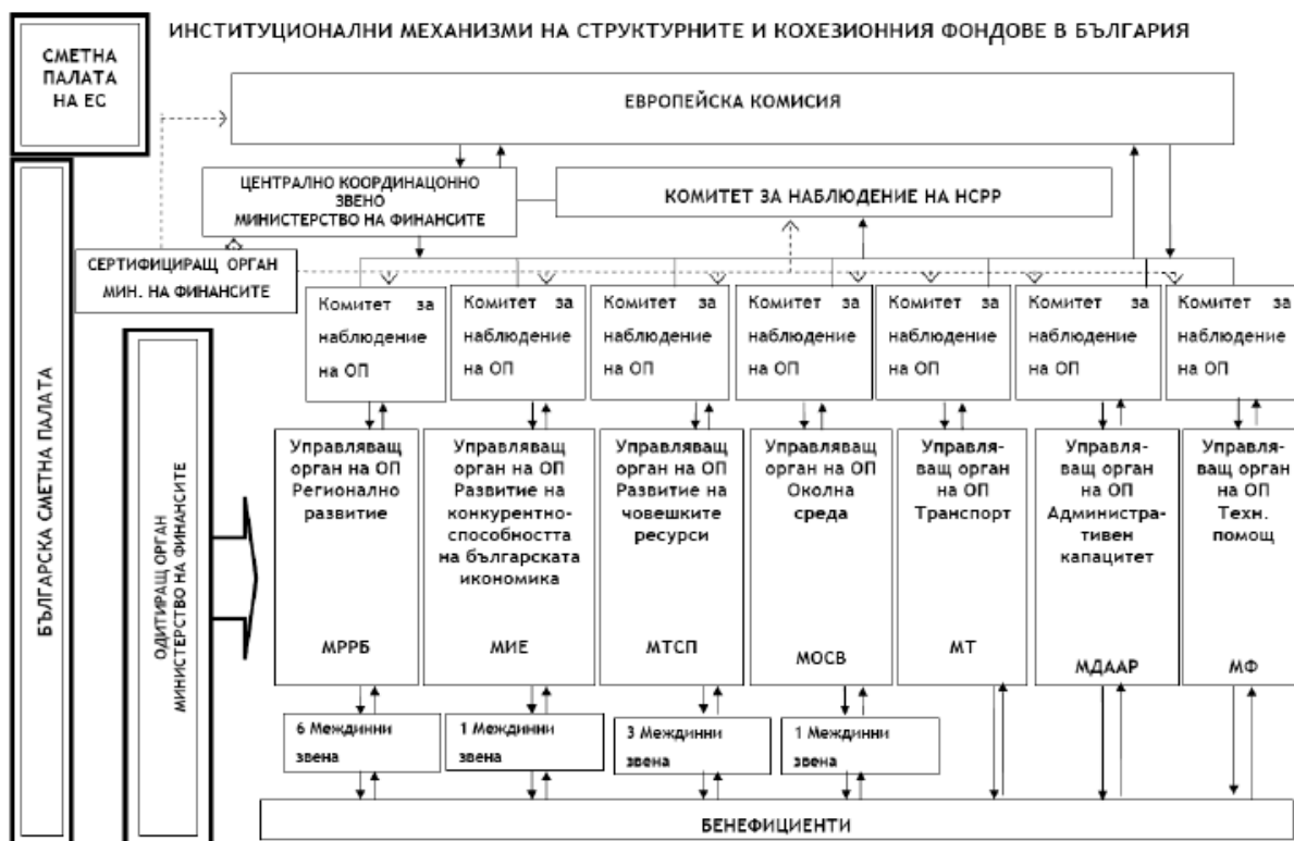
Източник: Национална стратегическа референтна рамка на България 2007-2013

подобряване на изпълнението на дейностите, финансирани от фондовете; приема докладите за НСРР, които се изискват според рамковия регламент на ЕО.